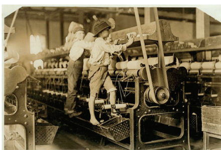
Enfants exploités dans une usine textile (1909) http://images.recitus.qc.ca/main.php?g2_it emId=6947

16 ans ; en 1900, elle passa à dix heures pour les moins de 18 ans. L'obligation scolaire, et corrélativement l'interdiction du travail en dessous de ce seuil, fut portée à 13 ans en 1882, 14 ans en 1936 et 16 ans en 1959. Cette législation a été récemment remise en cause d'abord par le gouvernement Jospin-Bufferet, qui a légalisé le travail des lycéens professionnels à partir de 13 ans dans le cadre des stages en « alternance », ensuite par le gouvernement Chirac-Villepin, qui a porté de 16 à 15 ans l'âge minimum à partir duquel peut être souscrit un contrat d'apprentissage.