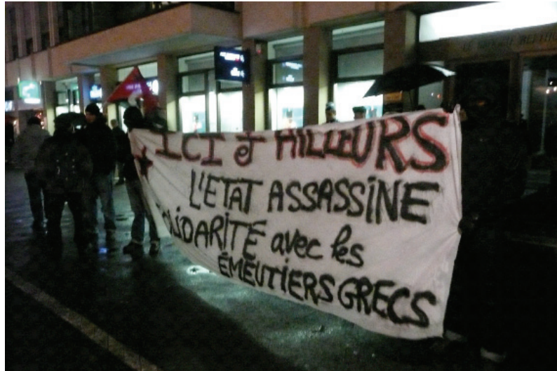
Manifestation de soutien aux émeutiers grecs, décembre 2008