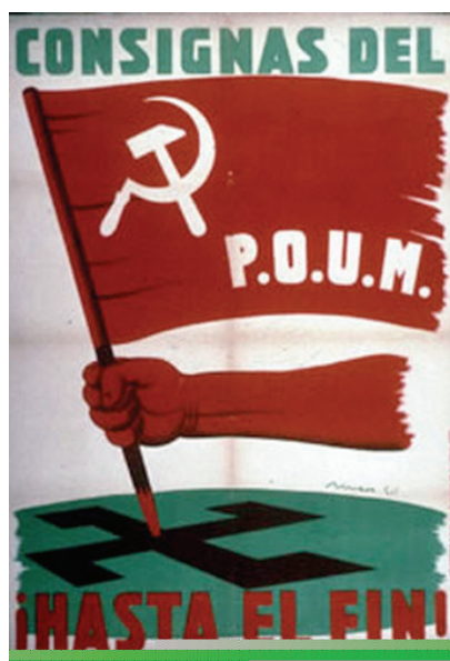
Affiche électorale du POUM

l'intégration des organes prolétariens de pouvoir à l'appareil d'État bourgeois, ainsi remis sur pied. Le POUM qui n'avait pas posé d'autres conditions à sa participation qu'un « programme socialiste » et la participation active de la CNT, entre aussi au gouvernement, où Nin, secrétaire général du POUM, devient ministre de la Justice. En fait de « programme socialiste », la bourgeoisie de l'Esquerra utilise habilement l'autorité incontestée des dirigeants de la CNT et du POUM sur la classe ouvrière pour la persuader d'accepter de dissoudre un à un les comités-gouvernements. La dénonciation par Trotsky de la signature par le POUM du programme du front populaire en janvier 1936 comme une trahison de la révolution, est souvent présenté comme sévère : les mois suivants confirme la justesse de cette condamnation.