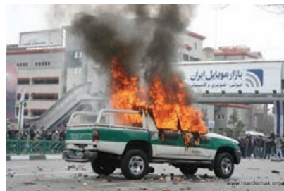
Une voiture de police en feu lors des manifestations du 27 décembre ( http://iranenlutte.wordpress.com )

approfondit la crise du régime et confirme qu'il s'agit d'une crise révolutionnaire, même si l'on ne peut prévoir ni les rythmes, ni l'issue de son développement 1 .