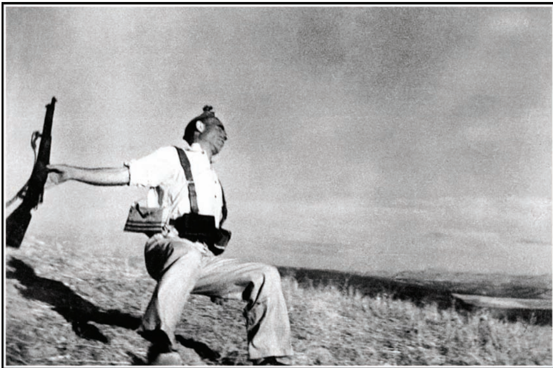
Célèbre photo de Robert Capa : un combattant républicain tué sur le front d'Andalousie le 5 septembre 1936

La révolution liquidée, le gouvernement mène la guerre. Mais précisément parce qu'il a liquidé la révolution, il ne peut plus gagner la guerre. Sur le terrain de la guerre classique, les troupes nationalistes, appuyées par l'Allemagne nazie et l'Italie fasciste sont supérieures aux troupes « républicaines » : mieux entraînés, mieux armés, mieux commandés. En outre, l'aide de l'URSS tend à diminuer. L'agonie durera plus d'un an, jusqu'en mars 1939. Elle sera parsemée de négociations impulsées notamment par l'Angleterre en vue d'un accord entre les « républicains » et les « fascistes » pour mettre un terme à la guerre et sceller une « réconciliation nationale ».