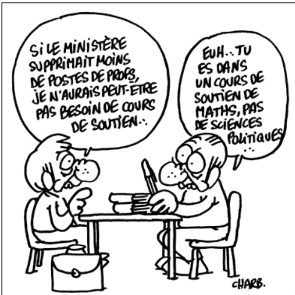
Dessin de Charb, site des jeunes communistes 76