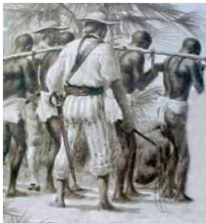
Travail forcé colonial

Pour mieux justifier auprès de l'opinion publique la nécessité de se tailler un Empire, d'y surexploiter la main-d'œuvre et d'y réaliser de juteux profits, la bourgeoisie républicaine a eu recours à une véritable fabrique du « sauvage ». Mise en scène, jeu sur les émotions, la peur, la terreur, tout a été bon pour présenter les peuples colonisés comme des sous-hommes proches de l'animalité. C'est ainsi qu'ont vu le jour, dans les années 1880-1890 et jusqu'aux années 1930 incluses, de véritables zoos humains où étaient exhibés, à la manière d'animaux en cage, des « spécimens » indigènes que l'on avait forcés à revêtir des tenues « barbares » ou à rester demi-nus, conformément à l'image qu'il s'agissait de véhiculer 3 . Les manuels scolaires officiels de la République ont propagé d'abondance les plus infâmes clichés ; ainsi, entre cent exemples, celui de Dupuis, quinze fois réédité à partir de la Première Guerre mondiale : « Les races qui peuplent la Mélanésie [...] sont des nègres, dont quelques-uns, tels les anciens habitants de l'Australie, sont affreusement laids ; ils habitent des cabanes infectes et sont pour la plupart lâches, poltrons et traîtres 4 . »