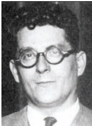
Andreus Nin, dirigeant du POUM

masses pour combattre le front populaire et avancer vers la conquête du pouvoir par le prolétariat, le POUM s'est efforcé de persuader les chefs réformistes de gauche et les anarchistes de le suivre, en essayant de leur démontrer la supériorité du capitalisme sur le socialisme. En outre, en constituant ses propres syndicats, ses propres milices, etc., le POUM s'est lui-même isolé des masses, alors qu'il aurait fallu au contraire travailler dans les organisations de masses, construire des cellules dans l'UGT et surtout la CNT. Si le POUM a sans doute sincèrement désiré la victoire de la révolution en Espagne, il a été dialectiquement, précisément en raison de sa politique centriste, le plus grand obstacle à la construction d'un véritable parti révolutionnaire en Espagne. De ce point de vue, la rupture de Nin et de la section espagnole de l'Opposition de Gauche avec le trotskysme et la IV e Internationale a eu des conséquences tragiques pour le prolétariat espagnol et mondial.