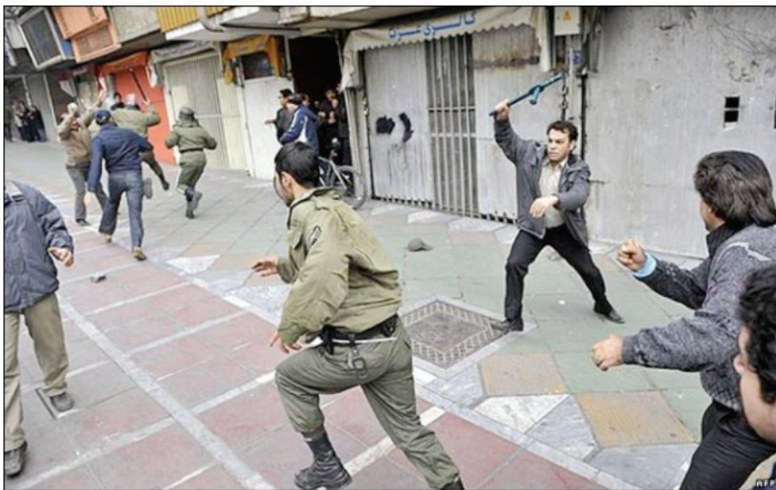
Maniféstation du 27 décembre à Téhéran ( http://iranenlutte.wordpress.com )