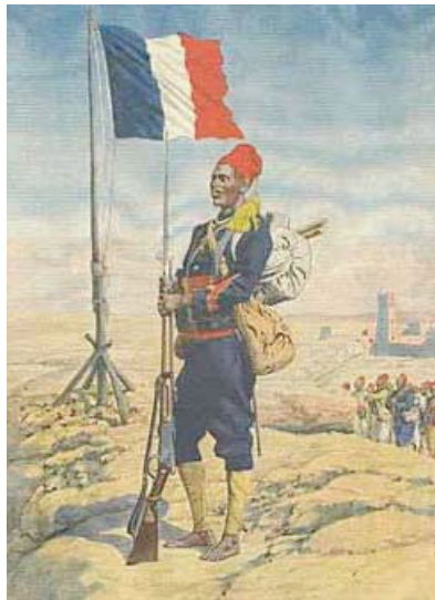
Affiche de propagande du gouvernement français pendant la Première Guerre mondiale : « Nos soldats d'Afrique. Le tirailleur sénégalais »

Or ces monstrueuses pratiques ont été l'œuvre non seulement de gouvernements « républicains », mais en leur sein de dirigeants prétendument « socialistes » et « communistes » : sous les gouvernements « tripartites » composés de ministres PCF, SFIO et MRP entre 1945 et 1947, sous la présidence d'un dirigeant SFIO, Vincent Auriol, jusqu'en 1954, et sous le gouvernement du « socialiste » Guy Mollet en 1956-57.