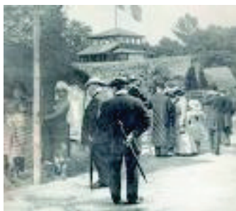
Visite d'un zoo humain, début du XX e siècle