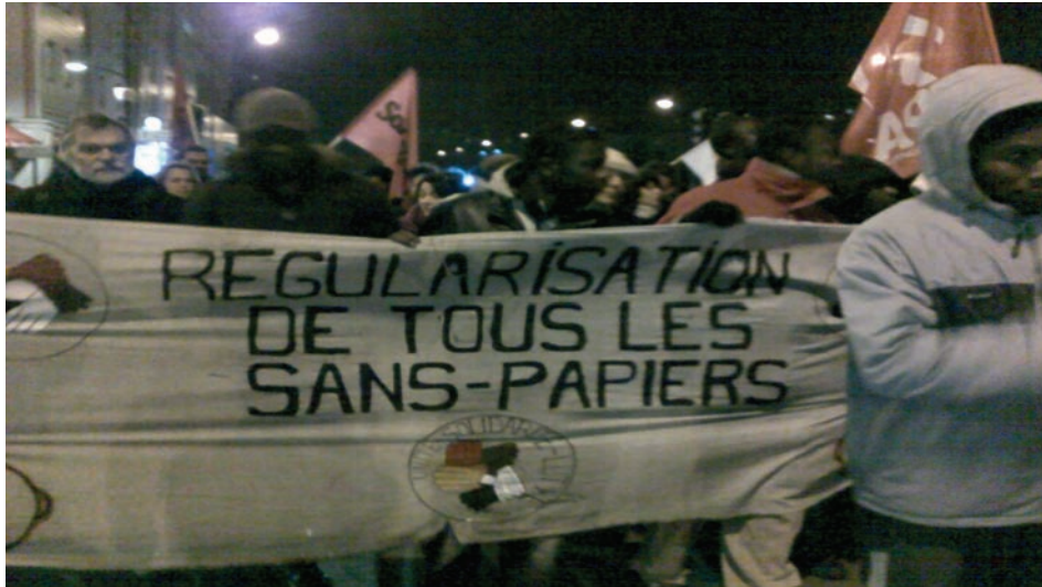
Manifestation des travailleurs sans-papiers de Vitry-sur-Seine (94), janvier 2010