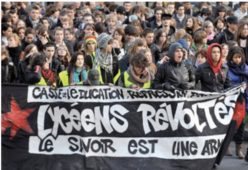
300 lycéens manifestent à Nantes le 3 décembre pour protester contre la réforme du lycée et les suppressions de postes