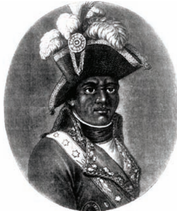
Toussaint Louverture (1748-1803), dirigeant de la révolution haïtienne à la fin du XVIII e siècle

La véritable mission des armées d'occupation est la répression du peuple haïtien, comme l'ont prouvé les déclarations des différents présidents de la région, en montrant que leur préoccupation était de « prévenir » les pillages et le désordre. Ces gouvernements, même dans des situations d'urgence, dévoilent leur vrai visage de défenseurs des intérêts de la bourgeoisie. Le rôle des troupes est de contrôler la population et de militariser le pays. C'est déjà le cas avec le contrôle de l'aéroport et les postes médicaux par l'armée états-unienne.