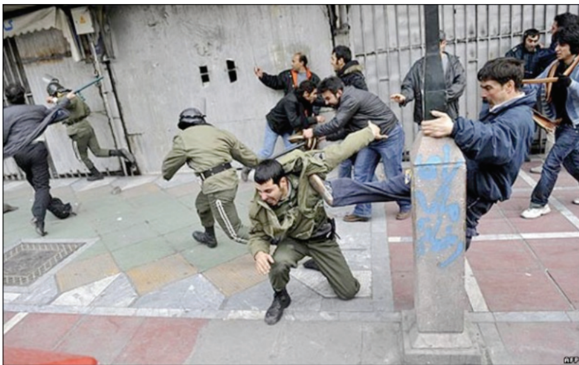
Manifestation du 27 décembre à Téhéran. Les manifestants infligent un recul aux milices du régime.

De ce point de vue, l'arrivée au pouvoir de Moussavi faciliterait la collaboration avec les impérialistes, car Ahmadinejad doit faire mine de rester un minimum nationaliste et anti-américain s'il veut rester au pouvoir. Mais elle ne mettrait pas forcément fin à la crise du sommet, car ses ennemis resteraient puissants dans le cadre du régime et rendrait plus difficile à justifier la répression des mobilisations populaires. En ce sens, la situation reste ouverte et, en tout cas, ingérable à terme pour les actuels chefs du régime.