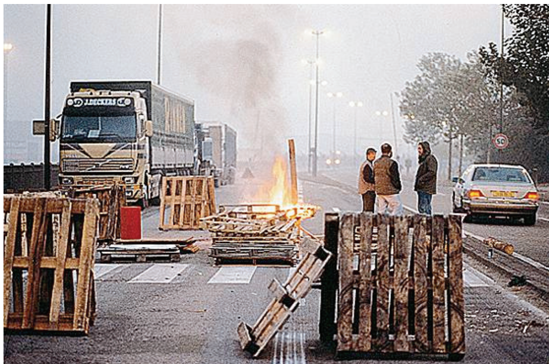
Piquet de grève de chauffeurs routiers en 1997

Autre exemple montrant la flexibilité et les ajustements sans fin que peut subir cette activité au nom du profit, la fameuse directive Bolkestein qui avait fait débat lors du référendum de mai 2005, prend ici tout son sens avec le transport routier : bien que ratifiée par le Parlement européen en février 2006, mais modifiée afin que le texte ne se réfère plus explicitement au principe du pays d'origine, l'activité du transport routier étant mobile, les États ont pu conjointement déréglementer le cabotage. C'est ainsi qu'un camion polonais, par exemple, peut effectuer un voyage Paris-Rennes et ce, autant de fois possibles dans la semaine de travail (60 heures maxi), du moment que le camion polonais amène du fret de Pologne et y retourne quinze jours après, les équipes polonaises se relayant par minibus entiers.