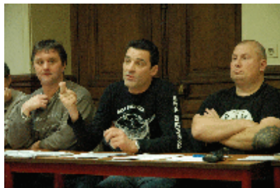
Conférence de presse des ouvriers de Continental le 6 janvier, Paris