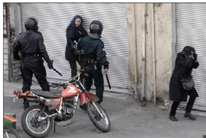
Répression de manifestantes le 27 décembre

Il est d'autant plus nécessaire de ne pas semer d'illusions sur le rôle que pourraient jouer les puissances impérialistes dans la chute du régime. C'est donc une faute politique de leur demander de rompre leurs relations diplomatiques avec l'Iran, comme le font les deux PCOI. Car les puissances impérialistes ne veulent pas plus mettre à bas ce régime qu'elles ne l'ont fait pour celui de Saddam Hussein en 1991, tant qu'elle peuvent accroître leurs affaires avec lui, même si elles espèrent vivement placer à sa tête des dirigeants plus conciliants.