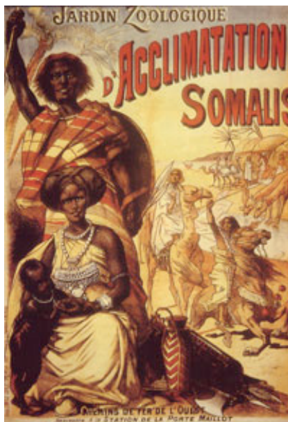
Affiche invitante à visiter un zoo humain, début du XX e siècle

« De race blanche, de culture gréco-latine et de religion chrétienne » (De Gaulle)