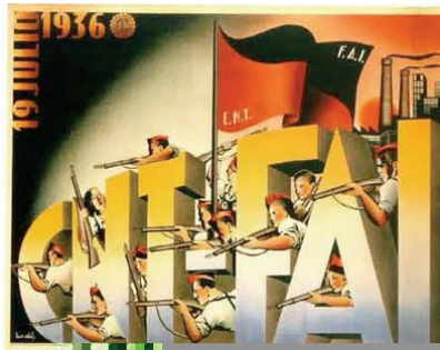
Affiche de la CNT-FAI

Enfin, les milices qui servent au front sont militarisées. Pour y parvenir, le gouvernement favorise les unités organisées par le gouvernement. Les unités dirigées par les staliniens, mieux armées et ravitaillées que les autres, sont montrées comme un modèle. Face à l'avance franquiste, il reçoit le soutien de la CNT pour dissoudre les conseils d'ouvriers et de soldats et construire une armée régulière. Les unités intégrées commencent par remplacer leur nom par un chiffre, les grades sont rétablis, l'élection des officiers est supprimée, enfin l'ancien Code Militaire est remis en vigueur.