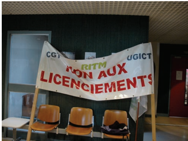
Les salariés de RITM au tribunal de commerce de Romans (Drôme) le 11 janvier