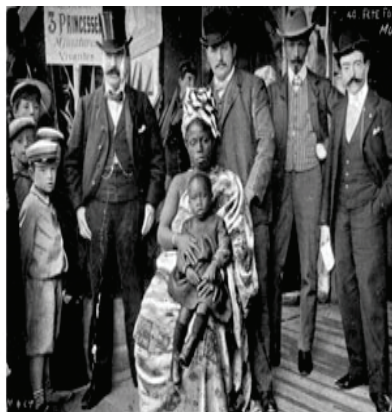
Visite d'un zoo humain, début du XX e siècle

de choisir la culture dominante 3 . Elle est une injonction à faire plus et mieux que les autres pour « mériter » sa place. Dans sa condescendance, elle classe ses archétypes de prédilection, le « bon Noir », la « beurette » ou le « musulman laïc », censés démontrer leur « adaptabilité ». Elle perpétue de la sorte les stéréotypes pour mieux entériner les stigmates et les repoussoirs, tels la femme voilée, nécessairement passive, soumise et à civiliser, ou le « garçon arabe » — « sauvageon » ou « racaille » —, nécessairement violent, voleur, violeur, voleur 4 et incivilisable. Ces figures, érigées en ennemis de l'intérieur, démontrent dans le même mouvement la proximité du racisme et du sexisme : en portant l'accent sur la musulmane voilée comme victime absolue de l'oppression des femmes, l'État bourgeois en exonère les Français « de souche » et en vient à relativiser la généralité de cette oppression 5 .