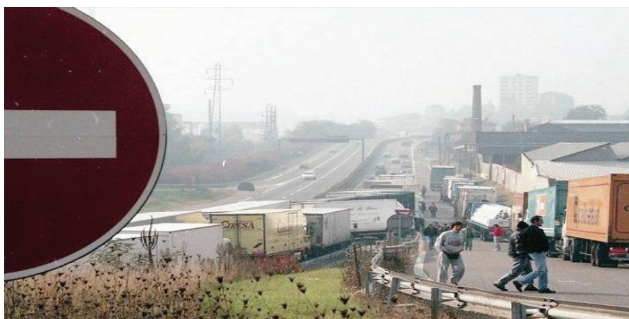
Blocage des voies publiques par les routiers en 95. Ce moyen de pression a été interdit par décret.